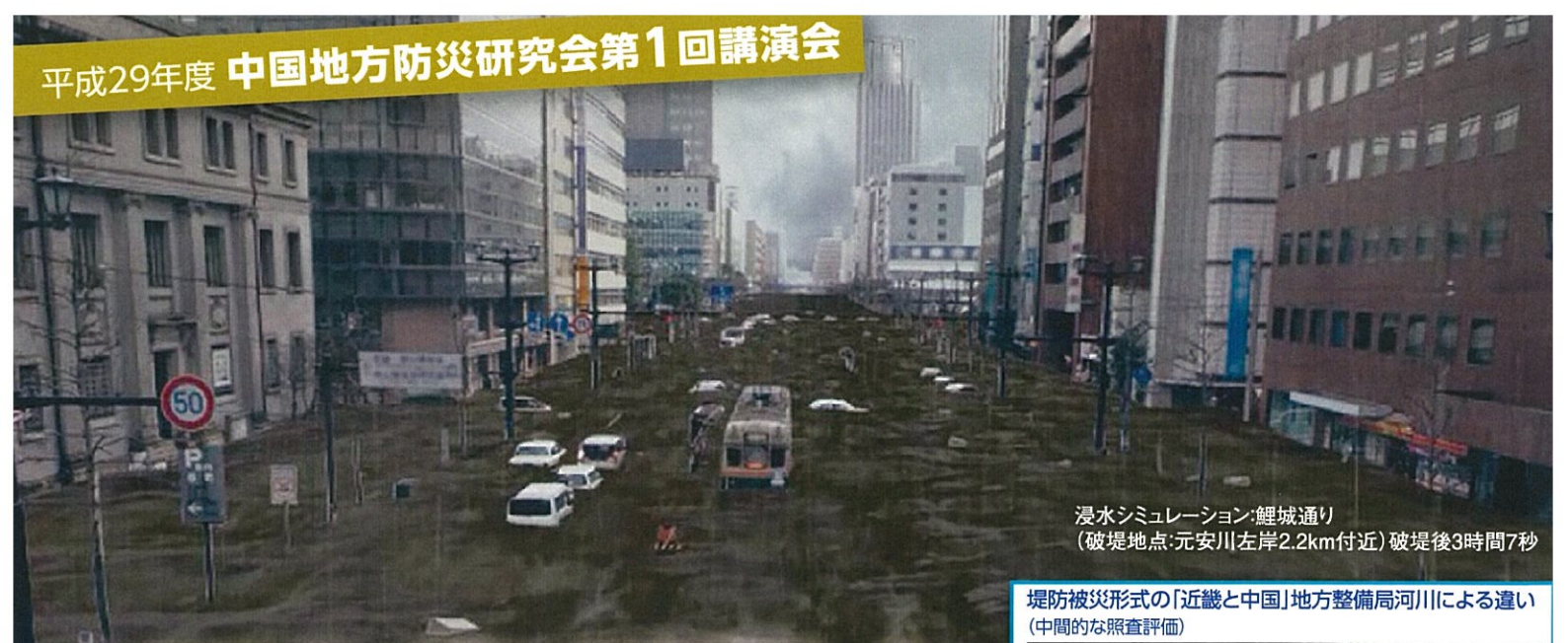
浸水シミュレーション:鯉城通り (破堤地点:元安川左岸2.2km付近) 破堤後3時間7秒