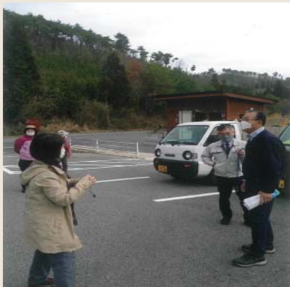
地域の方による案内