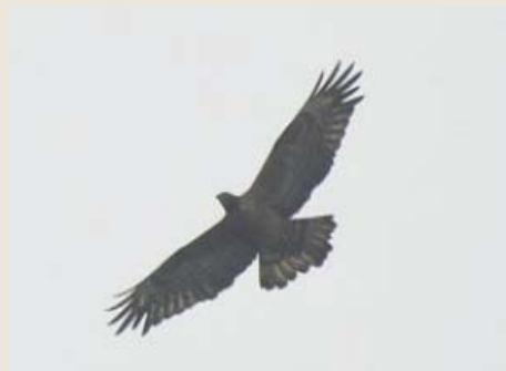
宇根山鷹の渡り（秋）