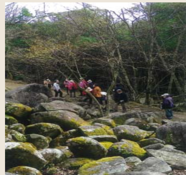
西遊旅行株式会社

○久井の岩海の価値・史跡の保護の大切さを知ってもらうため 自然環境学習などの活用場にする