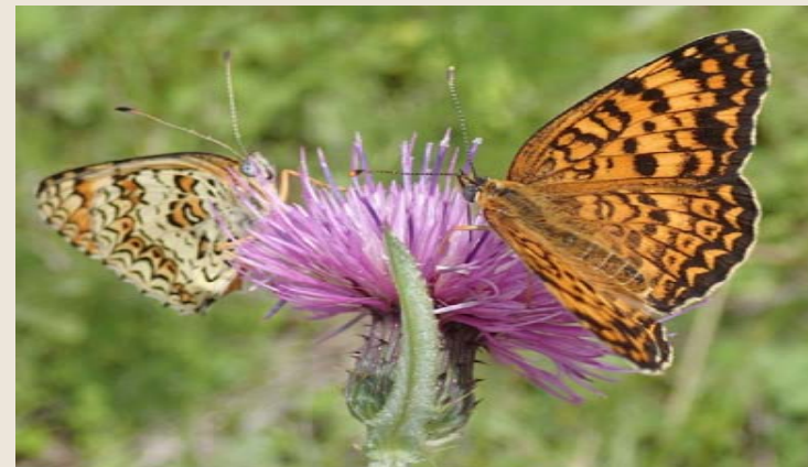
ヒョウモンモドキ（初夏）