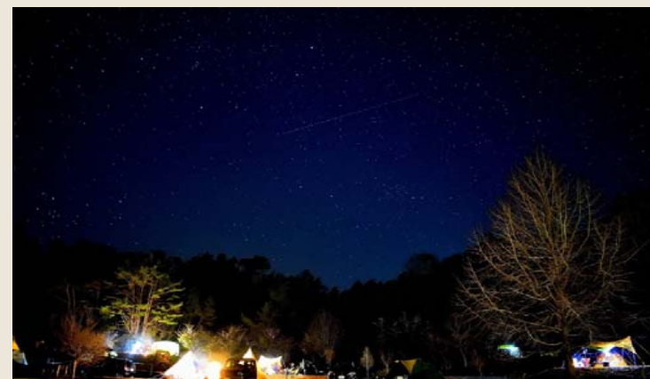
キャンプ場からみる星空（冬）