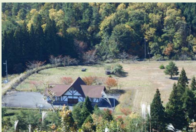
宇根山家族旅行村キャンプ場