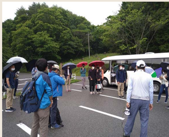
広島大学総合科学部