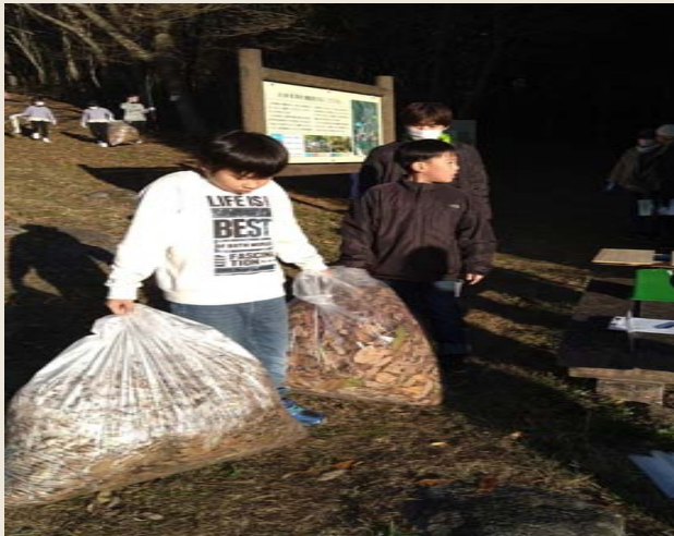
大人に見守れながら落ち葉を拾う子供たち

ただ落ち葉を拾うだけでなく、身近な感覚で 自然にふれあいながら、山の自然保護の大切さ 地元の史跡岩海の魅力を遊びを加えながら学ぶ