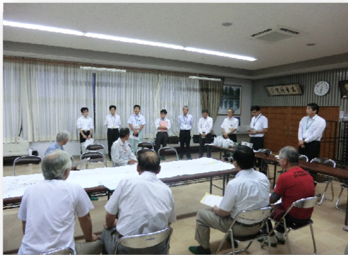
(事業推進協議会: 地元調整)